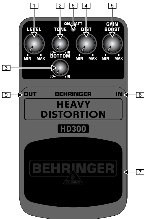
Vista lato superiore