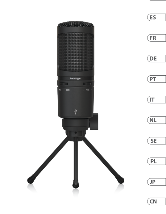
BM1-U Professional USB Condenser Microphone for Live-Streamers